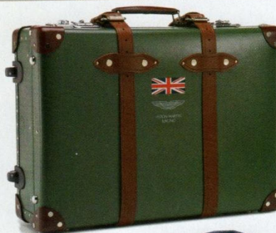
Malle Globe-Trotter en cuir, intérieur toile de coton satiné, 825 € le grand modèle, Hacke