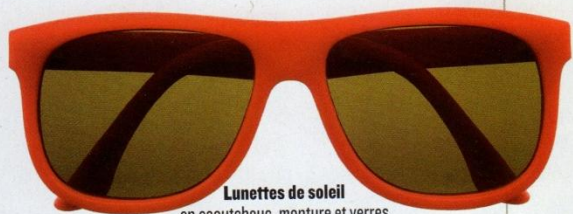
Lunettes de soleil en caoutchouc, monture et verres en matériaux recyclés, disponibles en marine, rouge, blanc, army, jaune et bleu électrique, 140 €, Vilebrequin.