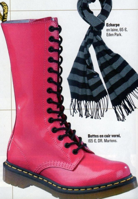
Bottes en cuir verni, 165 €, DR. Martens.