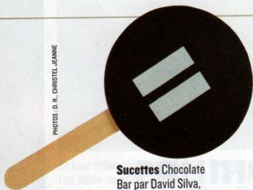
Sucettes Chocolate Bar par David Silva, 23,50 € les 4, Jean-Paul Hévin.