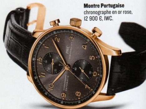
Montre Portugaise chronographe en or rose, 12 900 €, IWC.