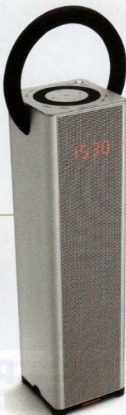
Enceinte portable BeoSound 3, 672 €, Bang & Olufsen.