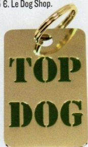
Médaille Top Dog pour petits chiens, 15 €. Le Dog Shop.