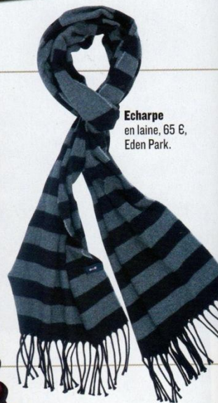
Echarpe en laine, 65 €, Eden Park.